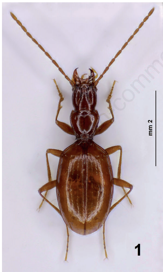
Fig. 1. Orotrechus frassanellicus sp. n., holotypus ♂: habitus.

Protorace poco trasverso, lungo 0.73 mm e largo 0.78 mm (rapporto lu/la: 0.94), a lati regolar-