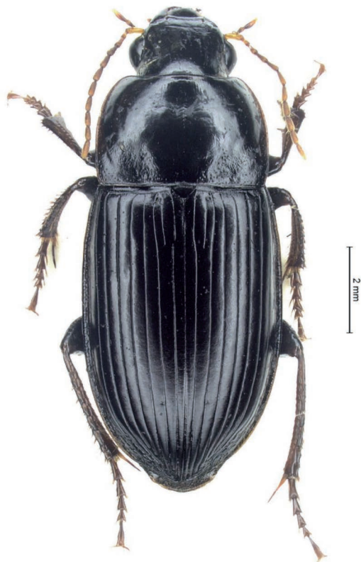
Fig. 1 - Esemplare femmina di Harpalus (Cryptophonus) melancholicus Dejean, 1829 censito nel luglio 2019 con lampada a luce di Wood in località Patro di Moncalvo (Asti).

fulvus Dejean, 1829 e H. melancholicus ). Quest'ultimo, descritto dei dintorni di Parigi e Berlino, è ampiamente distribuito dal nord Africa e dall'Europa meridionale e nord-occidentale fino all'Asia occidentale. È la specie maggiormente differenziata all'interno di Cryptophonus , presentando numerosi caratteri unici all'interno del sottogenere (Kataev, 2013). H. melancholicus viene distinto in due sottospecie che differiscono per la forma dell'apofisi prosternale e per la presenza/assenza di squame adesive sul lato ventrale dei mesotarsi del maschio: la ssp. nominotipica, che copre la maggior parte dell'areale della specie, e la ssp. reicheianus Kataev, 2013, distribuita lungo la costa settentrionale del Mediterraneo (Italia compresa). L'identificazione di questa specie non è problematica, dal momento che soltanto H. melancholicus e H. litigiosus , tra i Cryptophonus presenti in Italia, possiedono una serie di punti al-