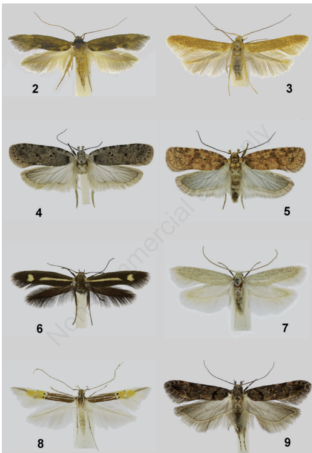
Figg. 2-9. Foto di alcune delle specie di maggiore interesse. 2 - Opogona omoscopa (Meyrick, 1893), ♀ (14 mm); 3 - Coleophora aspromontis Baldizzone, 2014 – ♂ (11 mm); 4 - Agonopterix thapsiella (Zeller, 1847), ♀ (25 mm); 5 - Agonopterix ferocella (Chrétien, 1910), ♂ (18 mm); 6 - Scythris aspromontis Jäckh, 1978, ♂ (16 mm); 7 - Pantacordis pallida (Staudinger, 1876), ♂ (12 mm); 8 - Cosmopterix coryphaea Walsingham, 1907, ♀ (9 mm); 9 - Teleiopsis laetitia Schmid, 2011, ♂ (19 mm).